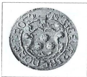
Pečeť Velkého Třebáňova z r. 1820.

V poli kulaté pečeti, doložené v roce 1820, byl barokní zdobený štít, v něm asi 3 lastury. Opis kapitálou oddělen linkou